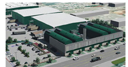
Centro de digestión anaeróbica de EDCO

El desperdicio de materiales orgánicos de tu contenedor verde terminará en un centro de desviación, de compostaje o de digestión anaeróbica. En estos procesos naturales, microorganismos degradan la materia orgánica, la cual será reciclada para producir gas natural renovable y enmiendas para el suelo.